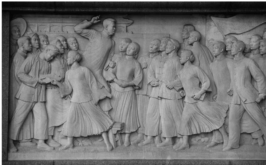
人民英雄紀念碑上的五四運動浮雕（資料圖片）

《未完的五四》延續了《作為一種思想操練的五四》的特色，即方法論層面上的思考。本書新增的文章，一方面具體展示了作者尋究五四歷史現場的實踐和努力，另一方面亦包含了作者對於五四在當下語境中的新思考。