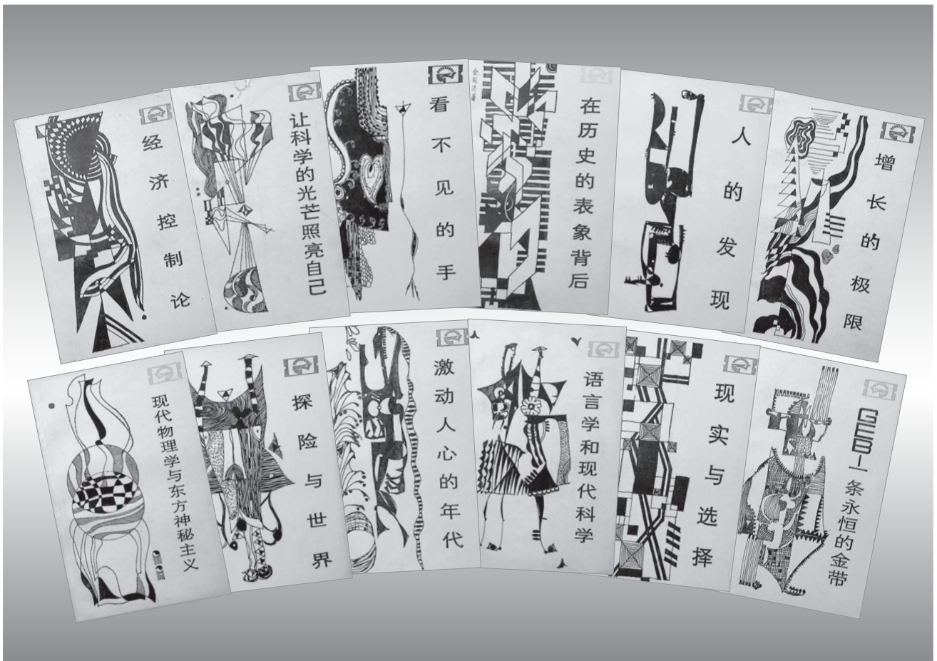
《走向未來》叢書第一批共十二本書籍（資料圖片）