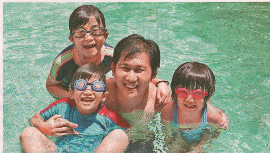
■佩戴隱形眼鏡時不適宜進行一些活動，如游泳、洗澡、睡覺等。