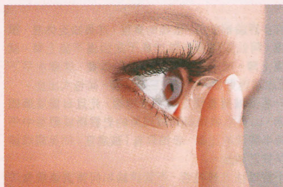
■旅遊期間，在不同地區因戴隱形眼鏡而引起眼睛問題的個案數字不斷上升。