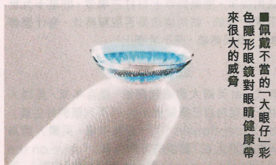
■佩戴不當的「大眼仔」彩色隱形眼鏡對眼睛健康帶來很大的威脅