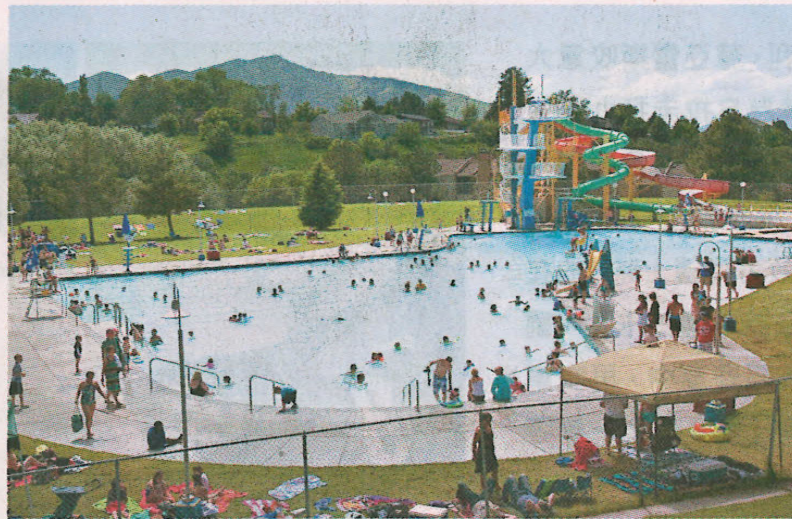
■游泳池可成為病毒溫床，如患有紅眼症不宜往公眾泳池游泳。

另外，他左眼在數日後亦開始紅了起來，在家庭醫生轉介下，明仔到了眼科診所求醫，經詳細眼科檢查後，醫生發現明仔患上了俗稱「紅眼症」的急性結膜炎。