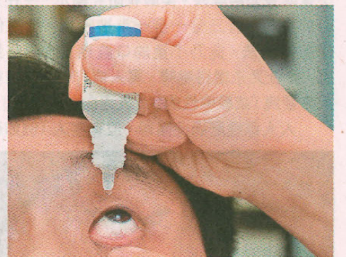
■滴眼藥水時先把下眼皮拉下，形成一個小袋子，再滴一滴眼藥水進眼內。