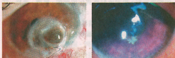
■角膜潰瘍引致穿孔