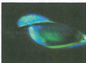
■螢光劑顯示角膜有磨損