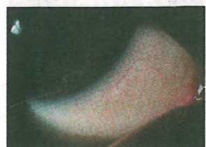
■慢性過敏性結膜炎結膜變成暗黃色及色素沉積